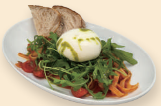
부라따치즈 토마토 페투치네 Tomato Fettuccine with Burrata 19.5