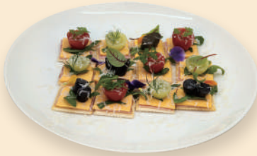
크래커 카나페 Cracker Canape 15.0