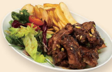
바비큐 폭립 BBQ Pork Rib 23.0