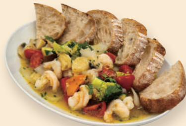
감바스 알 아히요 Gambas al Ajillo 24.0