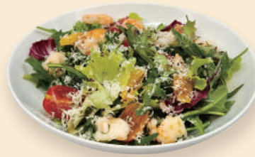
새우 루꼴라 샐러드 Shrimps Rucola Salad 16.5