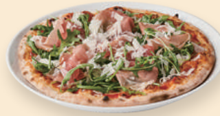
프로쉬또 루꼴라 Prosciutto E Rucola 26.0