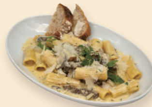
부채살 버섯 리가토니 Flat Iron Funghi Cream Rigatoni 23.5