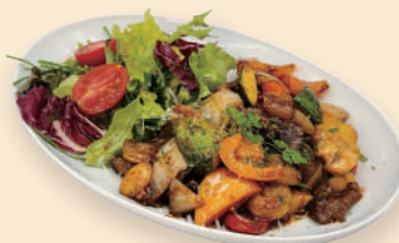
채끝등심 찹스테이크 Beef Striploin Chop Steak 29.0