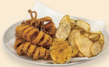
갈라마리(한치) 앤 칩스 Calamari Fried & Chips 22.0