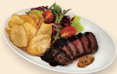
부채살 스테이크 160g Flat Iron Steak 29.0