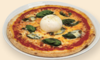
부라따치즈 마르게리따 Burrata Margherita 21.5