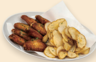
핫 윙 Hot Wings 20.0