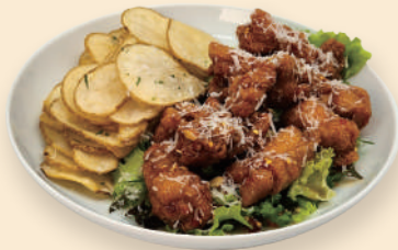
스윗칠리 치킨 Sweet Chill Chicken 16.0