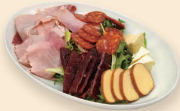
햄 앤 치즈 Ham & Cheese 22.0